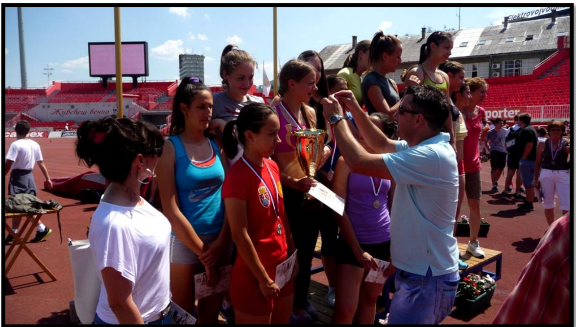
Додела медаља на Првенству Србије