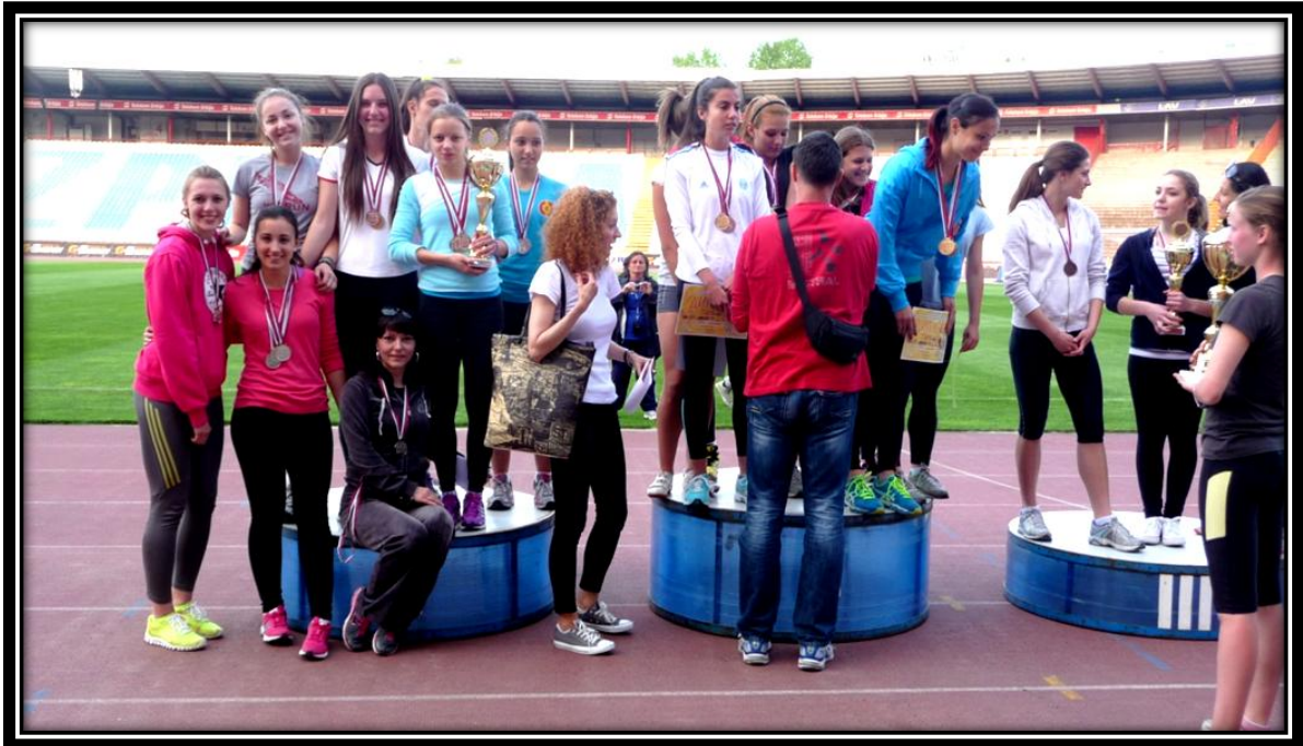
Екипа ученица 2. место у Београду