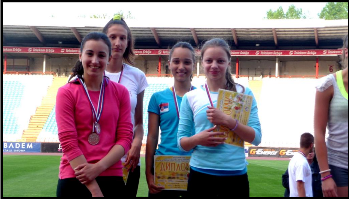
Ученице у штафети