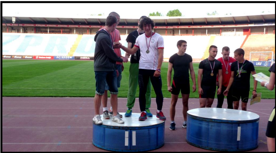
Ученици у штафети