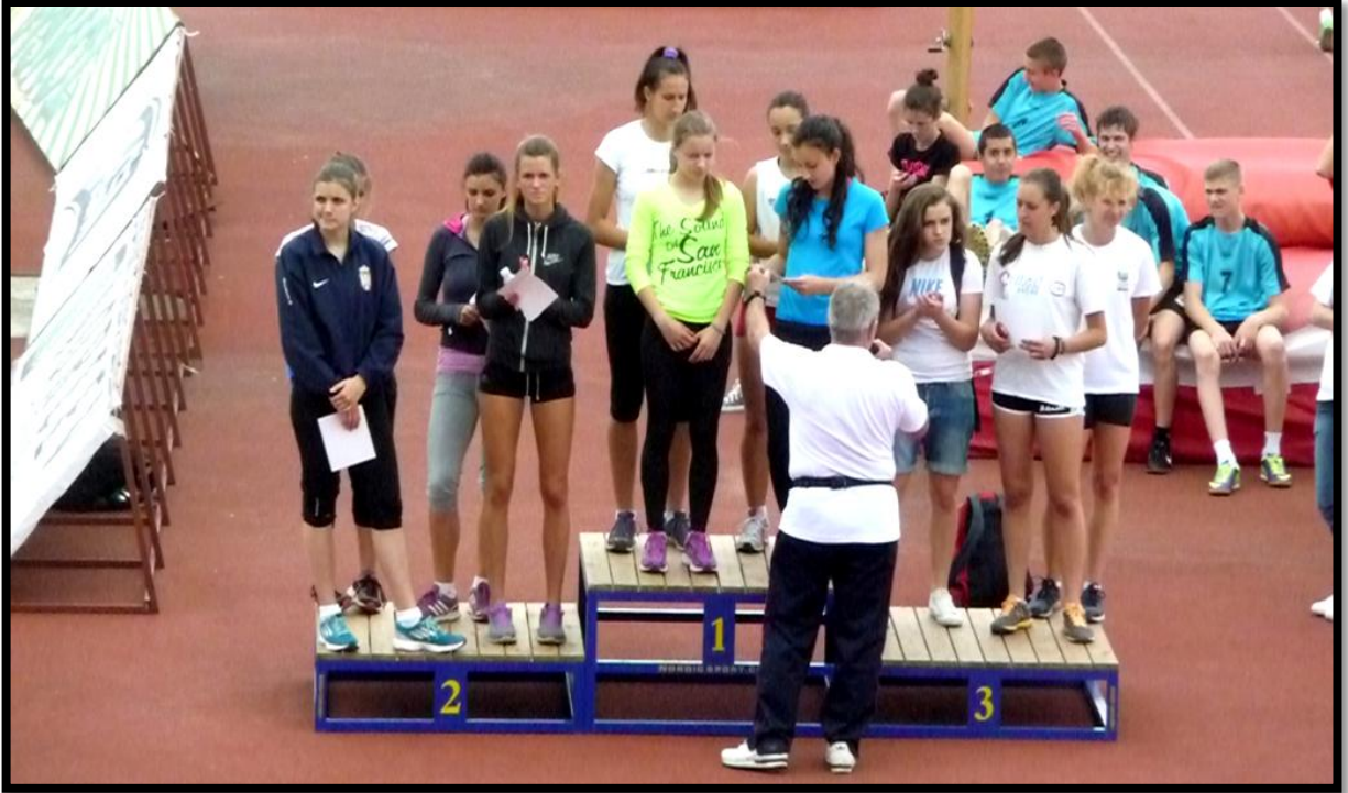
Штафета 4x100м ученице